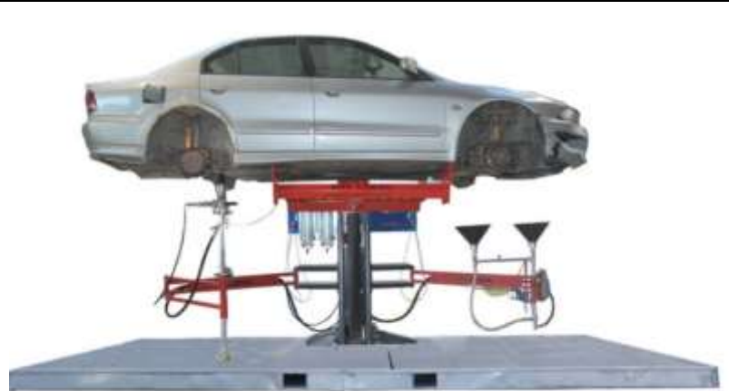
Tour de drainage SEDA