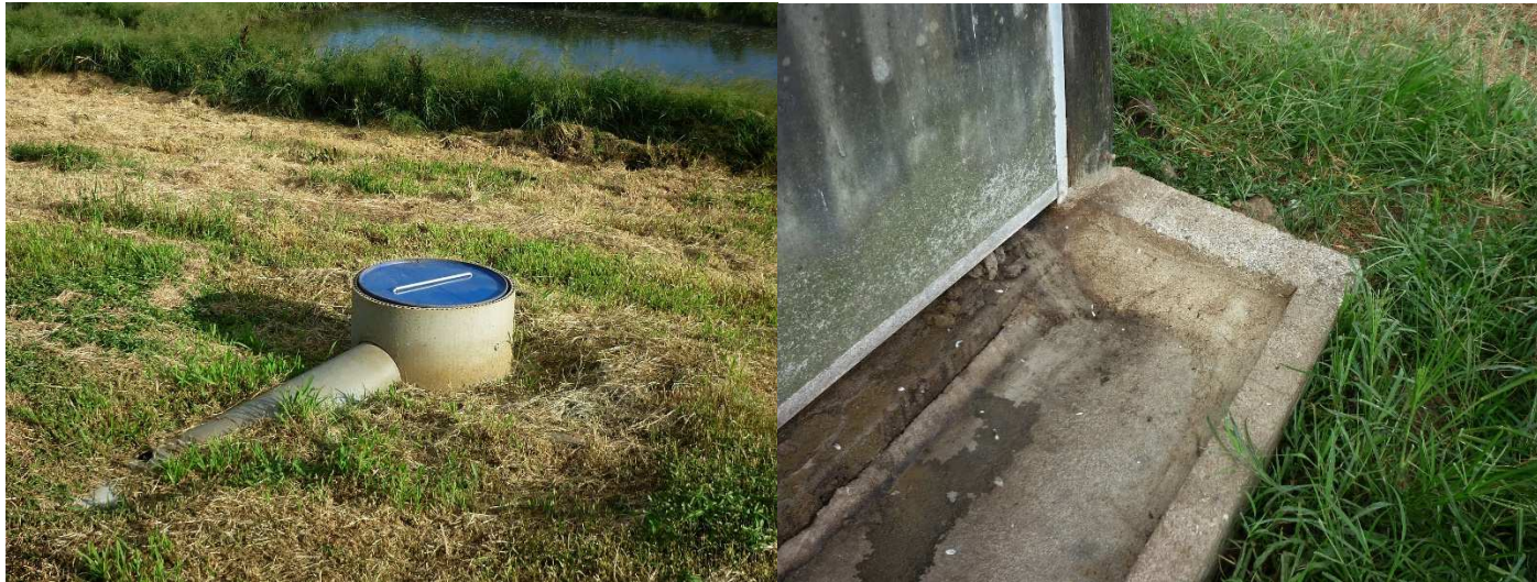
Réfection des réseaux de collecte