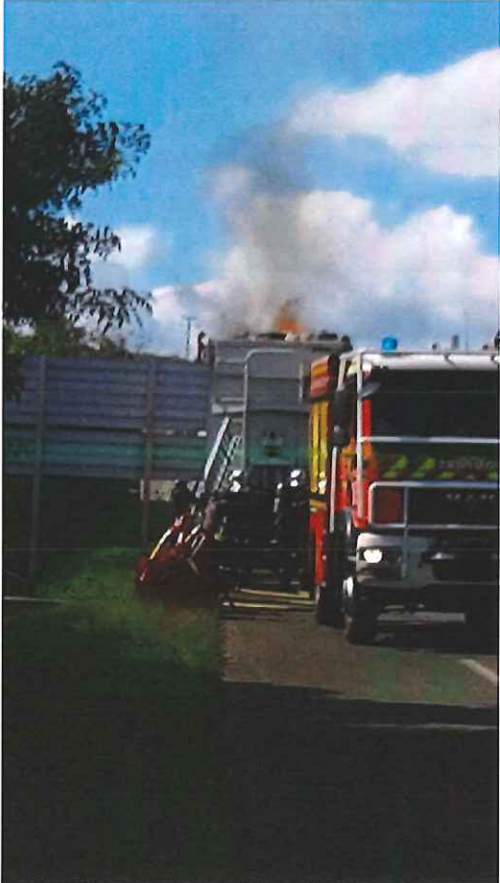
PHOTO 1 Intervention des pompiers sur la SAV EXPRESS.