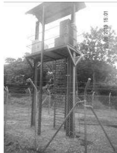
Poste de relevage