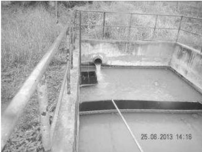
Ouvrage de tête