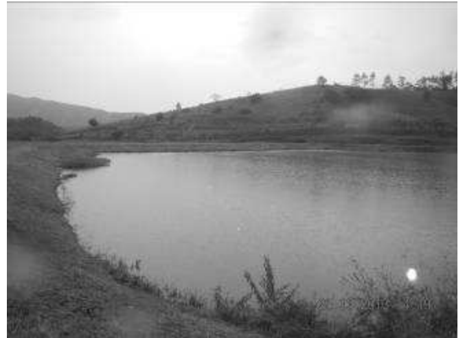
Bassin de lagunage n°1