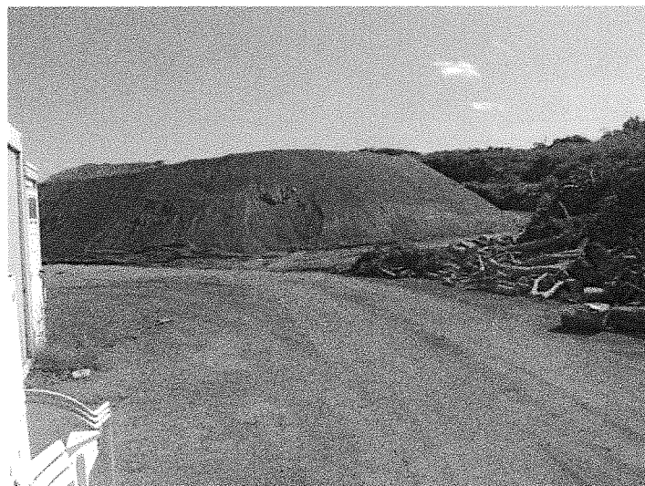
Photo 4 : tas de scories recouvrant les déchets verts ayant fait l'objet de l'incendie du 29/03/2011