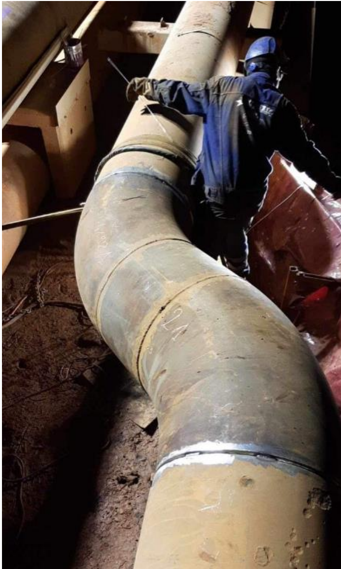
Double coude section - 255/256 face DWP1 Remplacement complet