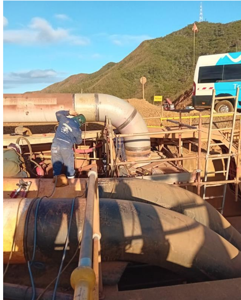
Coude section - 276 col de l'antenne Remplacement complet