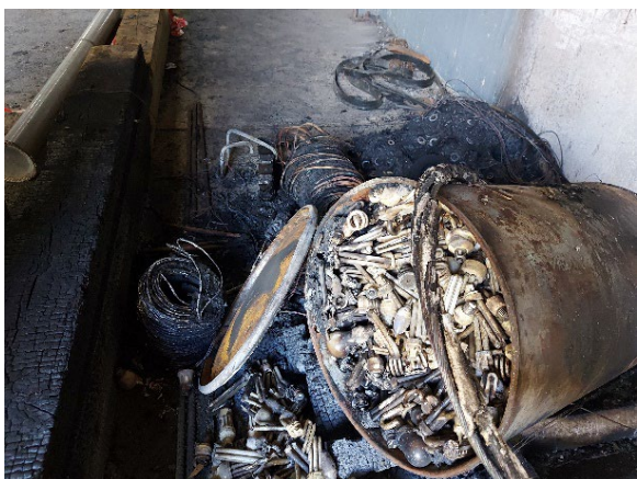
Fut de stock d'ampoules