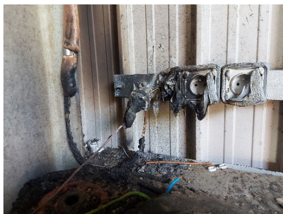
Prises de courant 240V recharge nacelle