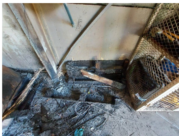
Rallonge et matériel électrique brûlés