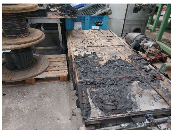
Porte neuve FMA brûlées