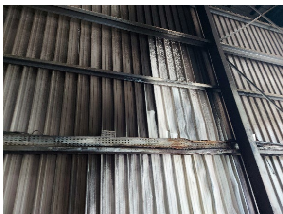
Bardage intérieur endommagé